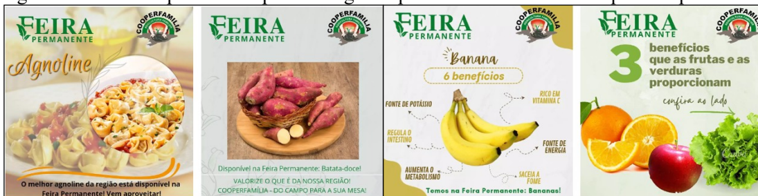
Figura 1 - Materiais produzidos para divulgar os produtos comercializados pela cooperativa

Lovatto et al. (2021) objetiva fidelizar o consumidor através da construção de relacionamentos a longo prazo, alicerçado no estreitamento das relações, no sentido de atrair, manter e aumentar o relacionamento, bem como despertar mais sensibilização sobre a responsabilização de quem compra sobre o que está sendo consumido e os modos de produção envolvidos.