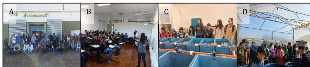
Figura 02: Oficinas Caracterização, Boas Práticas de Cultivo, larvicultura e Qualidade de Água em Criação de Camarão M. rosenbergii .

Durante as duas oficinas desenvolvidas no projeto, foram atendidos 78 alunos do ensino médio, dos municípios de Cantagalo, Quedas do Iguaçu, Rio Bonito do Iguaçu e Sulina (figura 2).