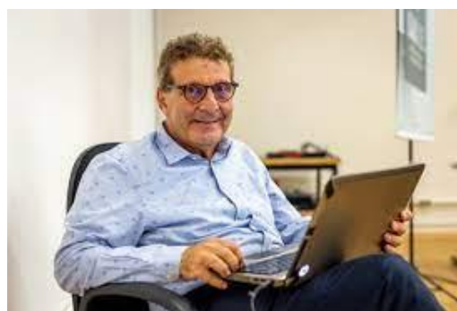
Figuras 1 e 2. Palestra de Nabil Bonduki na UEM sobre Plano Diretor.

Na capital paulista, Bonduki contribuiu com o Plano Diretor duas vezes, de 2001 a 2004, quando foi vereador e coordenou a elaboração do substitutivo do Plano Diretor Estratégico do Município de São Paulo e os Planos Regionais das 31 subprefeituras; e, entre 2013 e 2016, novamente como vereador e sendo o relator do Plano Diretor Estratégico de São Paulo. O que há de mais interessante nesse documento é a introdução do conceito de coeficiente básico 1, ou seja, estabelecer que tudo que vier a ser construído acima do coeficiente 1 tem que arcar com a outorga onerosa, verba que para a gestão pública municipal deve ser destinada para a redução das desigualdades urbanas.