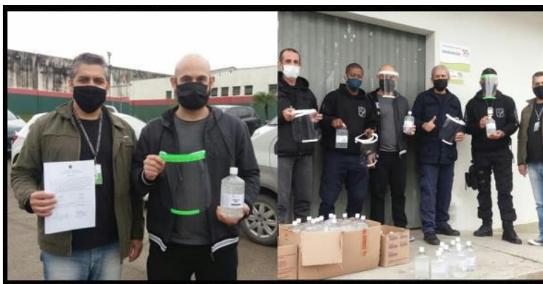
Figura 2 - Doação de face – shields e Álcool em gel.