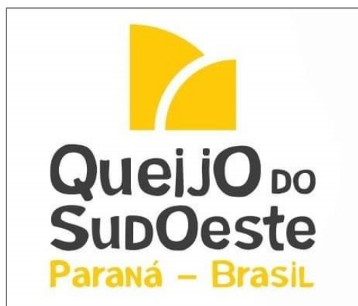
Figura 3 – Marca coletiva “Queijo do Sudoeste”