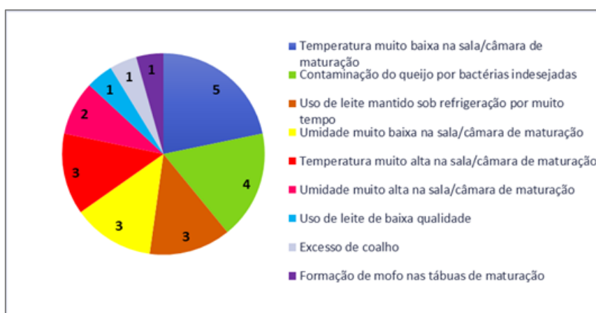
Figura 2 – Principais causas dos problemas/defeitos relatadas pelos produtores de queijo Colonial artesanal da região Sudoeste do Paraná, 2021

microrganismos indesejados (Figura 2). Realmente esses fatores estão ligados a alguns problemas observados nos queijos, porém as demais respostas do questionário mostraram que os produtores ainda não sabem associar corretamente as causas aos seus defeitos, visto que as principais causas de problemas como estufamento não foram relatadas; evidenciando a necessidade de promover atividades sobre esse tema.