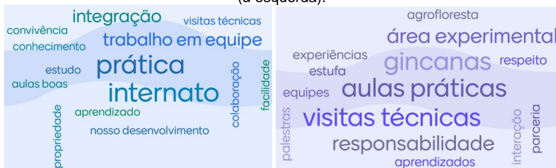
Figuras 1: Significados de Pedagogia da Alternância (à direita) e Instrumentos Pedagógicos (à esquerda).

Fonte: pesquisa de campo (FERREIRA; ROBAINA, 2022).