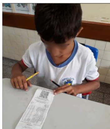
Figura 3: Estudante observando detalhes de uma nota fiscal.