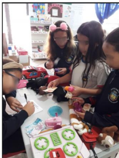
Figura 4: Simulação de um mercado.