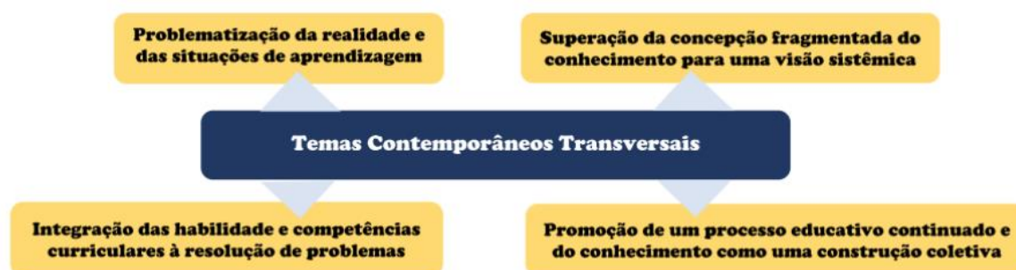
Figura 1: Quatro pilares da metodologia de trabalho dos TCTs