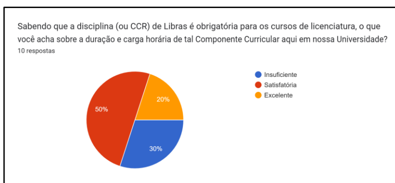
Ilustração 1: Questionário aos Acadêmicos que não haviam realizado a disciplina de Libras.

A criação e elaboração dos questionários partiu-se, inicialmente, de questionamentos e preocupações em relação com a formação inicial dos docentes, uma vez que espera-se que estes atuem em redes de ensino regulares, locais nos quais a inclusão é uma realidade, por vezes, forçada. Muitas escolas não possuem um planejamento ou, quiçá, especialistas em educação inclusiva, para que haja uma promoção da inclusão de forma saudável e adequada. Tendo em vista este ambiente recorrente, é necessário entender como está ocorrendo a formação dos futuros docentes. Assim, através dos formulários digitais, foi questionado aos acadêmicos que não haviam realizado o componente curricular de Libras e, após, aos acadêmicos que já haviam realizado, o que pensavam sobre a duração de 60 horas (ou um semestre) de tal disciplina, e se acreditavam ser o suficiente para suprir as suas necessidades de conhecimento da língua, com isso, obtivemos as seguintes respostas: