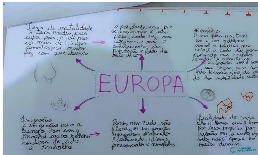
Figura 2: Mapa conceitual elaborado pelos estudantes.

As características do continente foram apresentadas através de desenhos e informações de que os estudantes julgaram significativas. A partir das imagens, é possível perceber os elementos visuais contidos nos respectivos mapas conceituais com o intuito de expressar fenômenos ou elementos socioespaciais que tratam das características gerais da população europeia, como as taxas de natalidade e qualidade de vida, bem como problemas sociais como por exemplo, a violência da xenofobia na Europa.