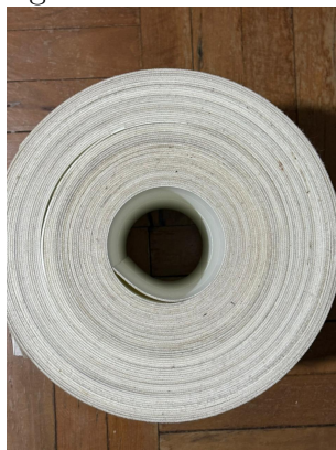
Figura 1: Esteira de PU

Particularmente o interesse pelo tema discutido nesse trabalho teve origem em um problema de determinar o comprimento de uma esteira depois de sucessíveis cortes, identificado por um controlador de almoxarifado, como a esteira da Figura 1.