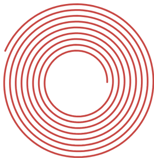
Figura 2: Representação esteira em forma de espiral