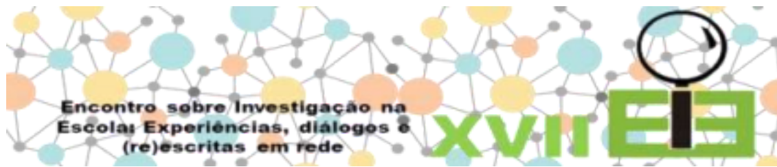
Figura 2: Cartaz de divulgação