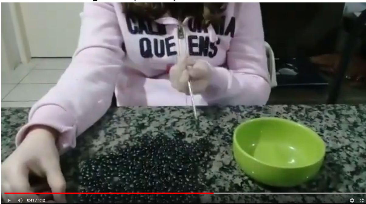
Figura 4: Apresentação dos trabalhos inscritos